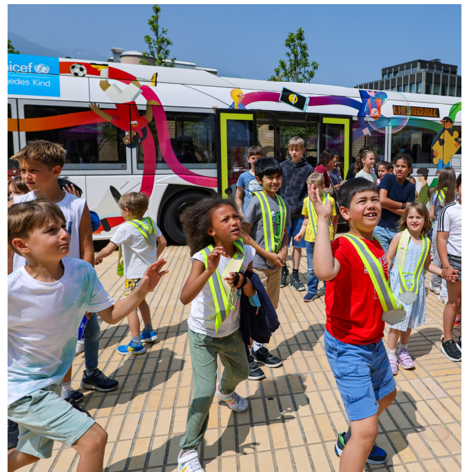
Liechtenstein: Der Kinderrechte-Bus wurde am 11. Juni, dem Internationalen Tag des Spielens, feierlich eingeweiht. Ein Jahr lang fuhr er quer durchs Land und machte Kinder wie auch Erwachsene auf Kinderrechte aufmerksam.

Unternehmen können durch ihr Handeln in ihrer gesamten Wertschöpfungskette Auswirkungen auf die Kinderrechte haben – direkte, wie z.B. in den Bereichen Kinderarbeit, Marketingpraxis oder Produktsicherheit. Oder indirekte, etwa über die Arbeitsbedingungen für Eltern oder Folgen für die Umwelt. UNICEF setzt sich dafür ein, dass Kinderrechte in den relevanten Regulierungen berücksichtigt werden, und unterstützt Unternehmen dabei, auf Risiken und Auswirkungen ihrer Tätigkeiten auf die Kinderrechte zu achten.