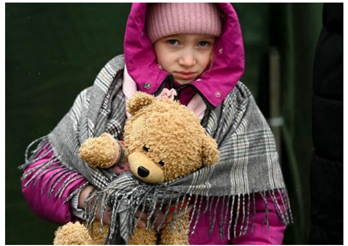
Ukraine: © UNICEF/JUN0601050/Doychinov/AFP