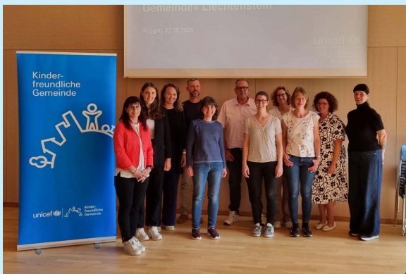
Table ronde au Liechtenstein

Début septembre, les «Communes amies des enfants» du Liechtenstein se sont retrouvées à Ruggell pour leur 3e table ronde. L'échange d'expériences et les nouveaux projets visant à améliorer la vie des enfants et des familles étaient au cœur des discussions. Des représentants politiques et administratifs des six communes ont pris part à la rencontre.