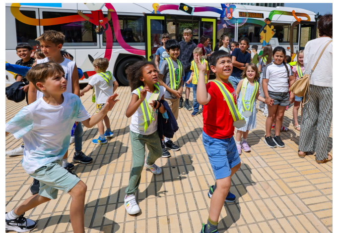
Liechtenstein: Le bus a été inauguré lors d'une cérémonie le 11 juin, à l'occasion de la Journée internationale du jeu. Pendant un an, il sillonne le pays pour sensibiliser petits et grands aux droits de l'enfant.

Les entreprises ont un impact sur les droits de l'enfant par le biais des activités de leur chaîne de valeur. Cet impact peut être direct, lorsqu'il a trait au travail des enfants, à l'usage du marketing ou à la sécurité des produits par exemple, ou indirect, lorsqu'il concerne les conditions de travail offertes aux parents ou l'environnement. L'UNICEF s'engage pour que les droits de l'enfant soient pris en compte dans les réglementations pertinentes et aide les entreprises à mener des actions pour éliminer les risques et gérer les conséquences de leurs activités sur les droits de l'enfant.