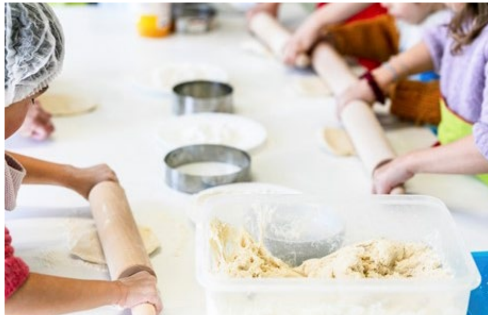
La Bâtie des enfants nell'inverno 2023.