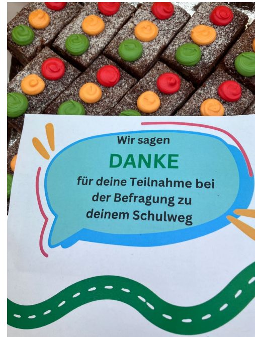
Foto della merenda di ringraziamento per i bambini partecipanti. La foto è stata consegnata alle classi scolastiche coinvolte.

Nell'ambito dei lavori relativi al piano per la sicurezza del tragitto casa-scuola e sulla base dei riscontri forniti da scolaresche e genitori, sono stati realizzati due nuovi passaggi pedonali e tre ampie segnalazioni a forma circolare. Queste misure migliorano la sicurezza, aumentano l'attenzione degli utenti della strada e rendono più chiaro e attrattivo l'incrocio in cui convergono cinque strade.