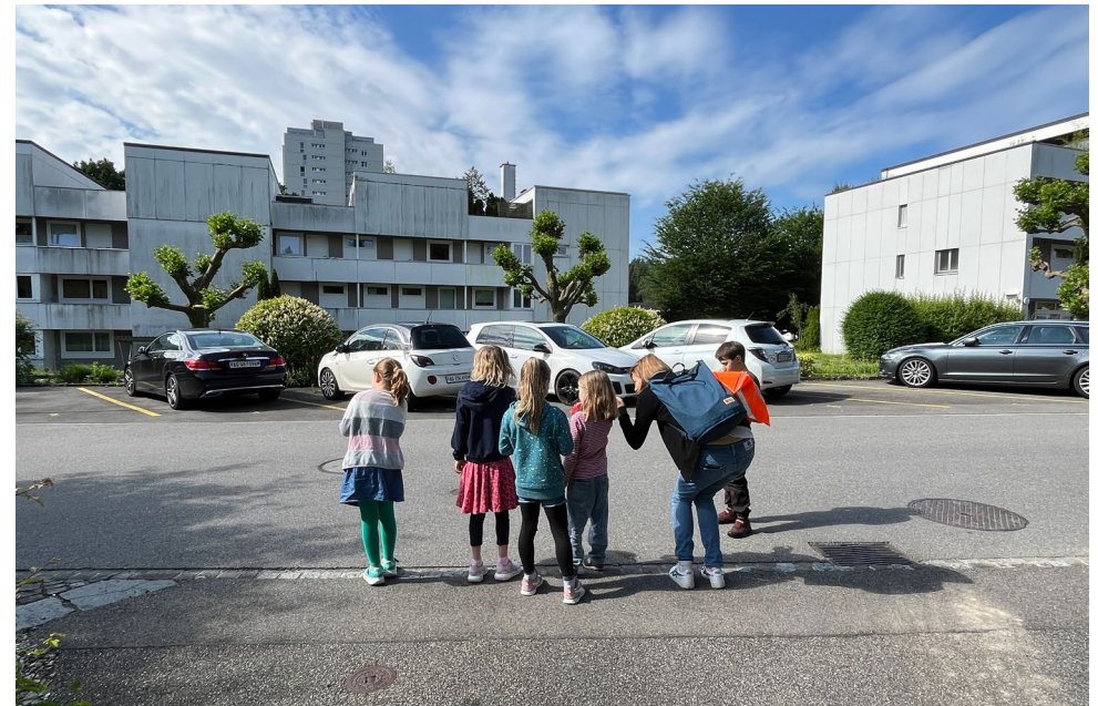
Sopralluogo del tragitto casa-scuola

Foto della merenda di ringraziamento per i bambini partecipanti. La foto è stata consegnata alle classi scolastiche coinvolte.