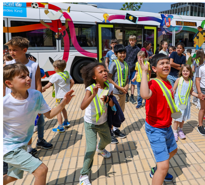
Liechtenstein: l'autobus è stato inaugurato ufficialmente l'11 giugno, in occasione della Giornata internazionale del gioco. Per un anno ha attraversato il Paese, sensibilizzando grandi e piccini sui diritti dei bambini.

Attraverso il loro operato, le imprese possono influire sui diritti dell'infanzia in modo diretto in tutta la loro catena del valore: per esempio con il lavoro minorile, le pratiche di marketing o la sicurezza del prodotto. Oppure indirettamente, per esempio attraverso le condizioni di lavoro per i genitori o le conseguenze per l'ambiente. L'UNICEF si impegna per far rispettare i diritti dell'infanzia nelle regolamentazioni importanti e incoraggia le imprese a eliminare i rischi e gestire l'impatto della loro attività sui diritti dell'infanzia.