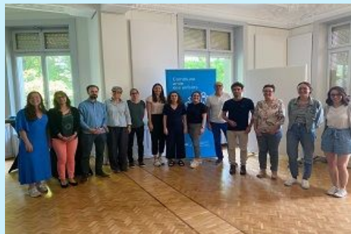
Tavola rotonda Comuni amici dei bambini Svizzera occidentale

Il 30 maggio si è tenuta a Losanna la prima tavola rotonda dei nostri «Comuni amici dei bambini» della Svizzera occidentale: una buona occasione per rafforzare le relazioni con e tra i Comuni e le città che hanno preso parte al processo.